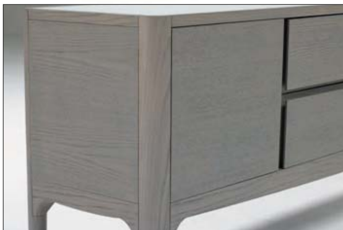
Side view detail