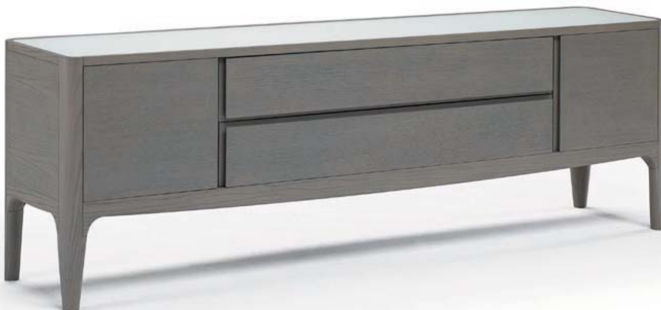
1 W00335102001205 sideboard • Smoked Oak