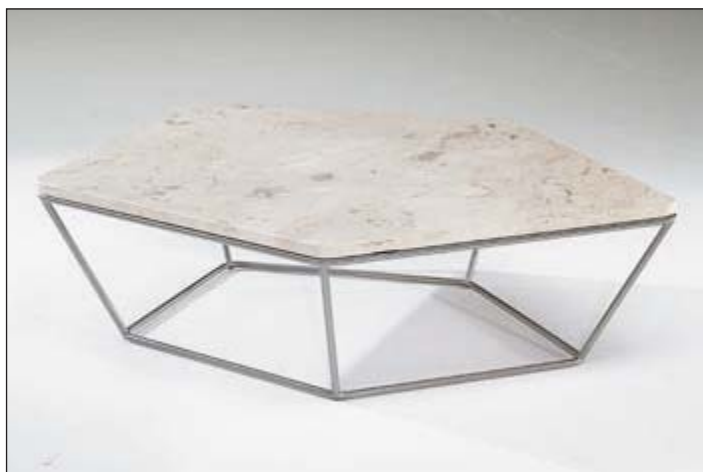
T108FS3 central table • White Travertine