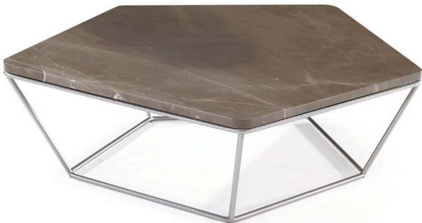
1 T108F93 central table • Amani Stone