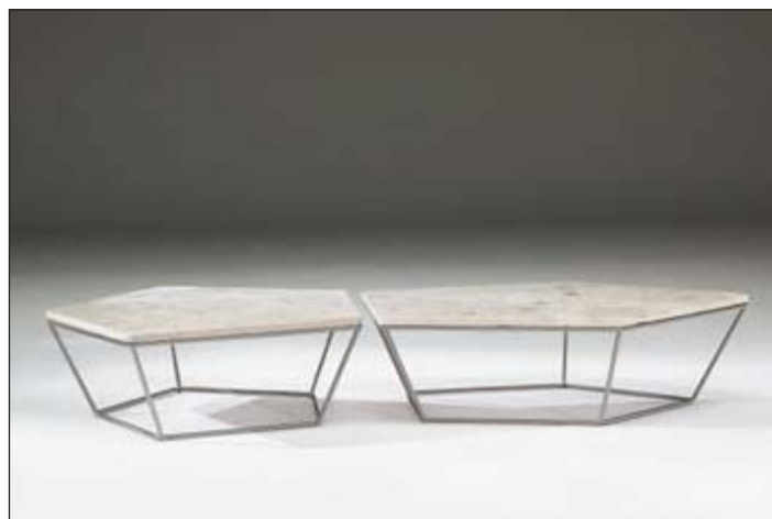
Central table (2pcs) • White Travertine