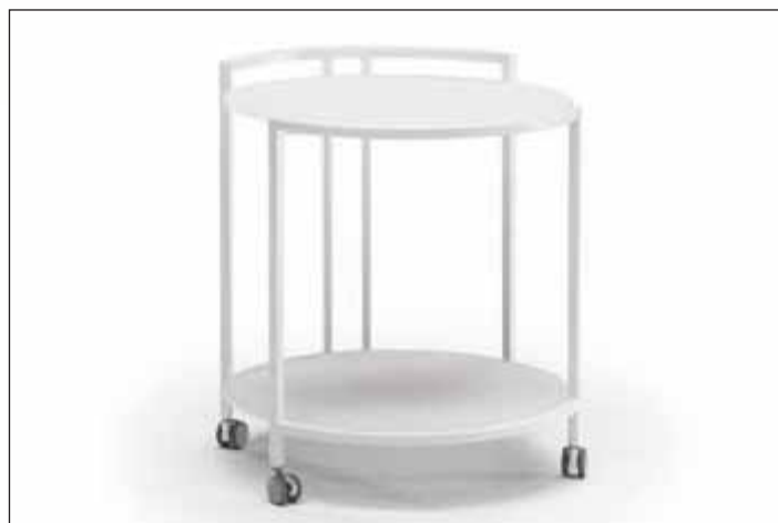
T118MY0 accent • Matt white glass