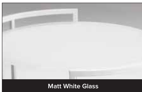
Matt White Glass