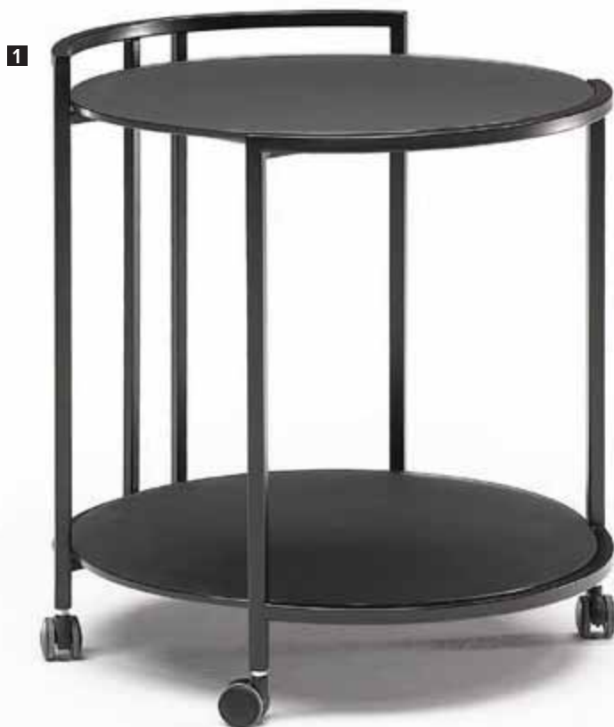
1 T118MM0 accent • Matt brown glass