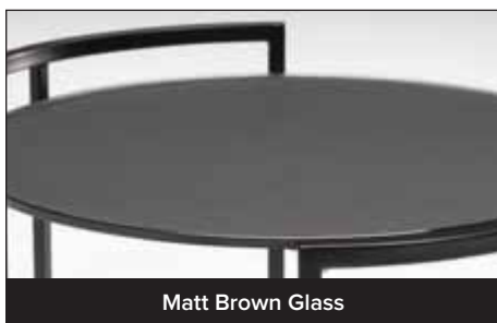
Matt Brown Glass