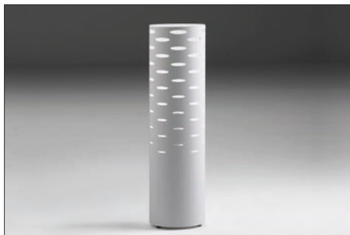
L490TQ_(*) table lamp • White