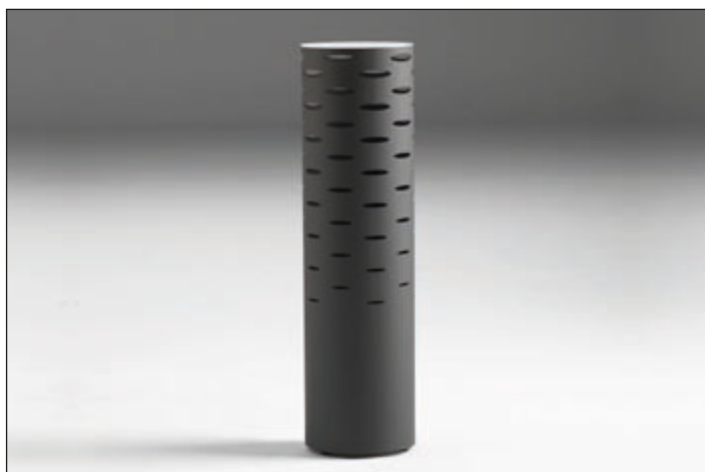
L490TM_(*) table lamp • White